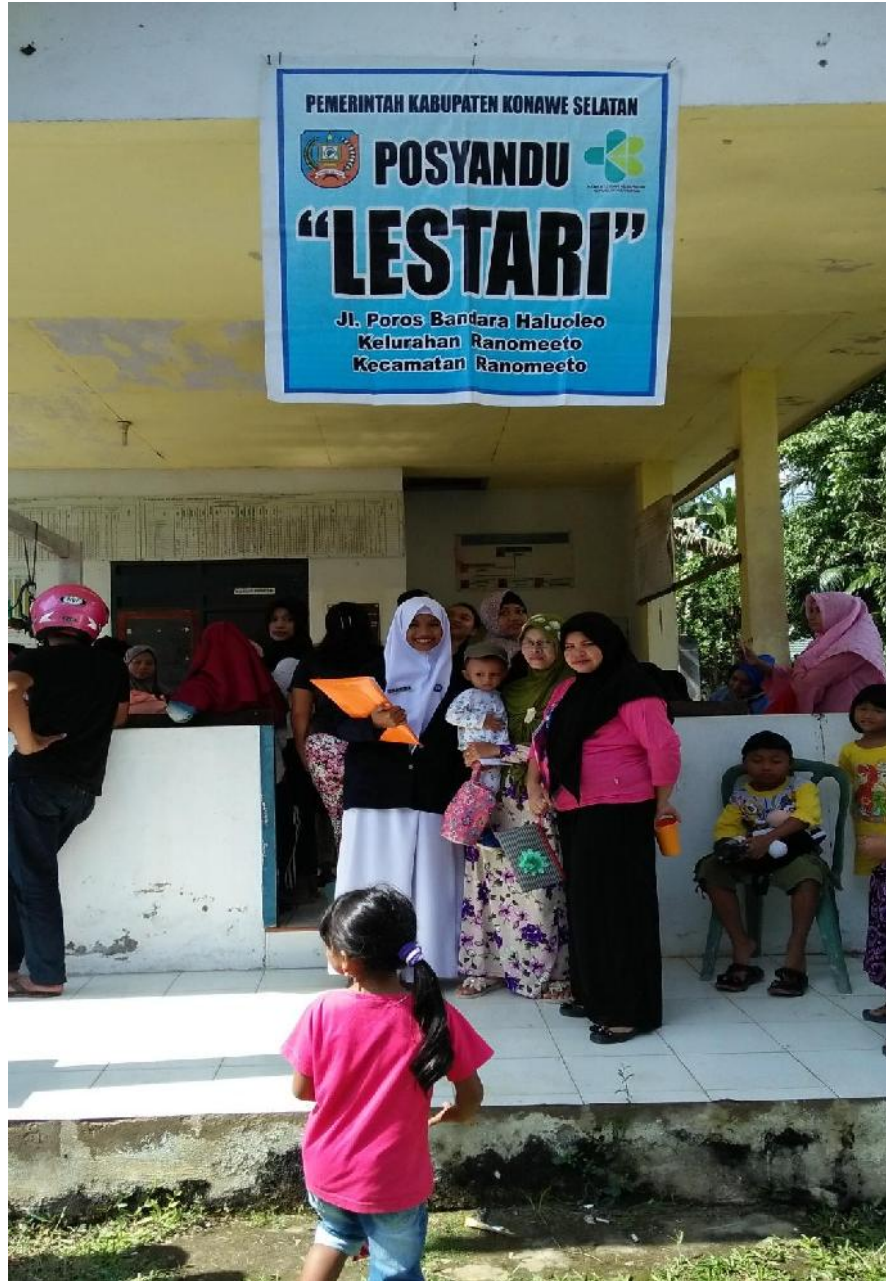
Posyandu Lestari Kelurahan Ranomeeto