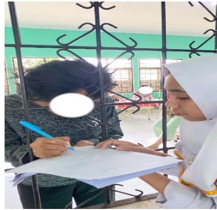
memberi bedak pasien