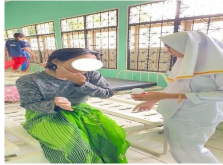
Meminta persetujuan pasien