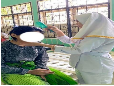
Tahap berkenalan dengan pasien