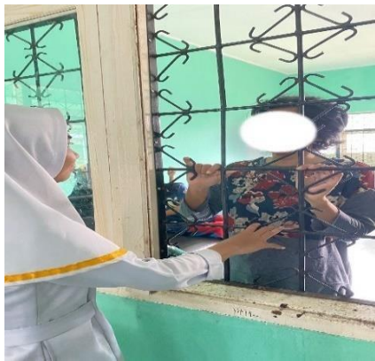
Menyisir rambut pasien