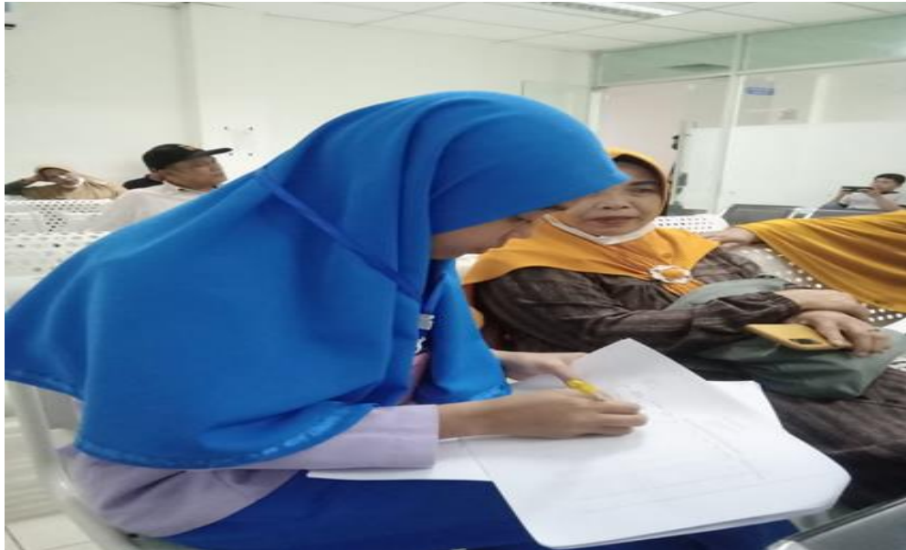
Gambar : 4 proses wawancara