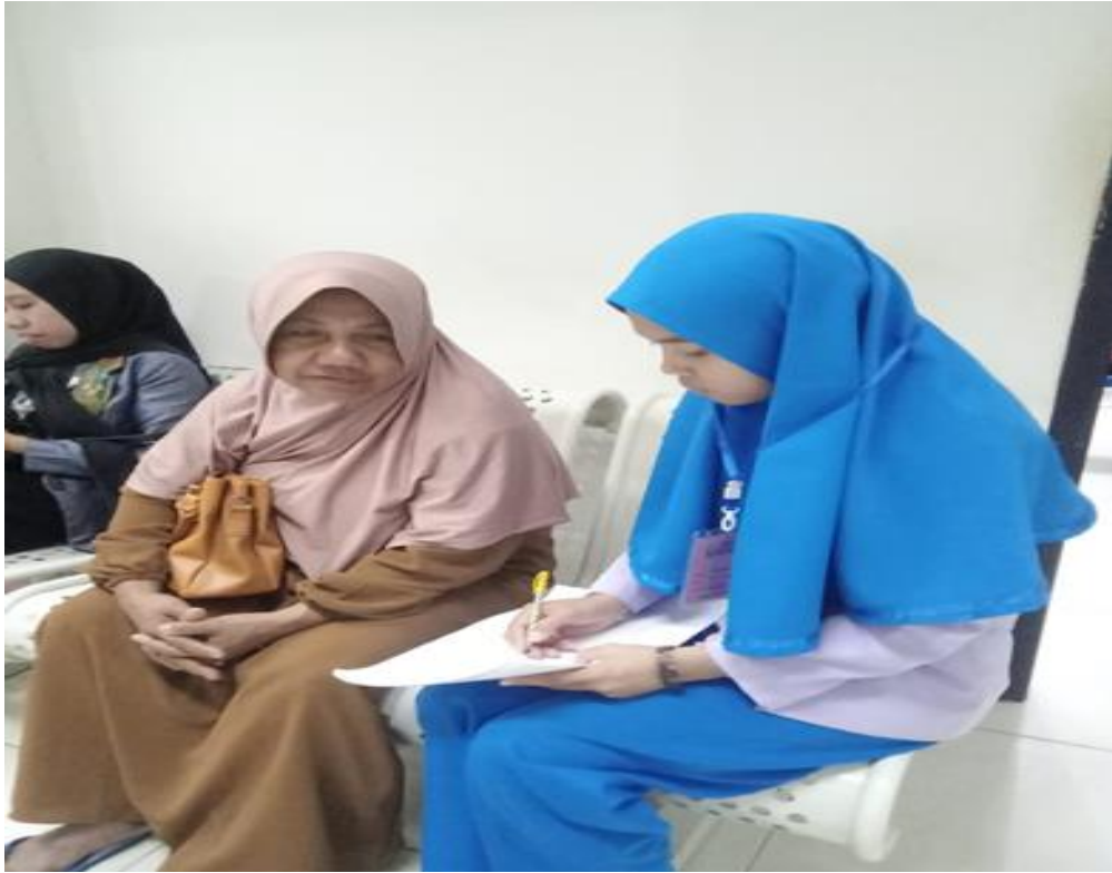
Gambar : 3 proses wawancara