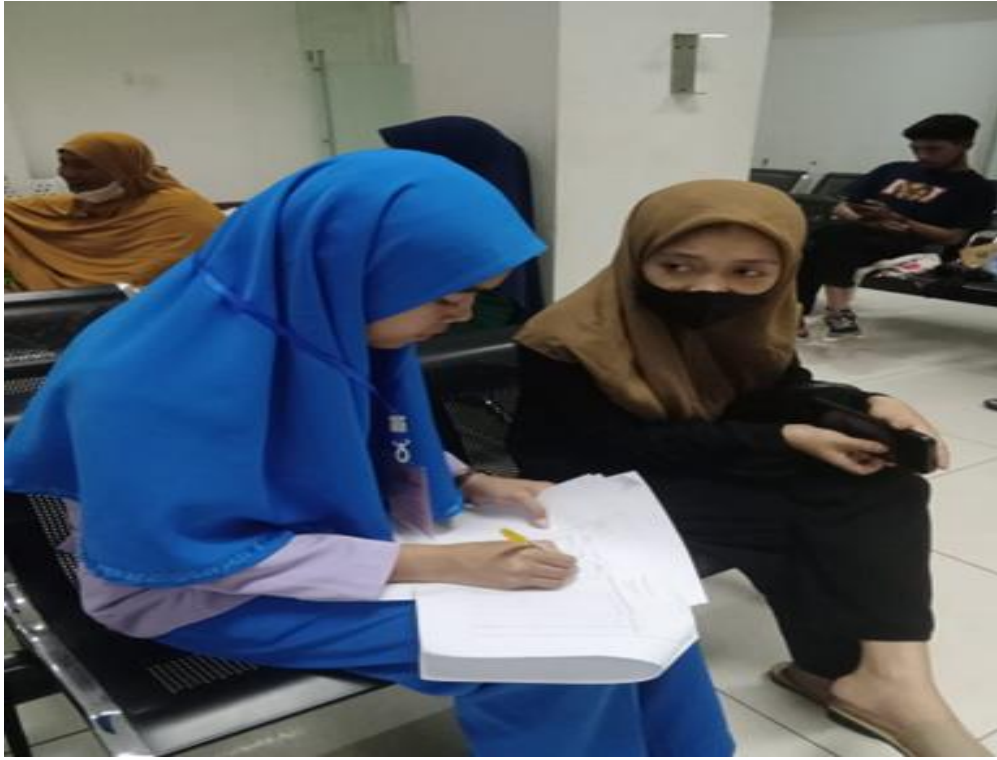
Gambar : 1 proses wawancara