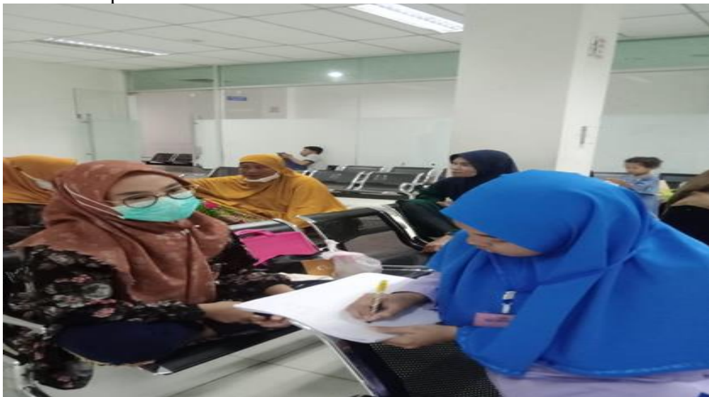
Gambar : 2 proses wawancara