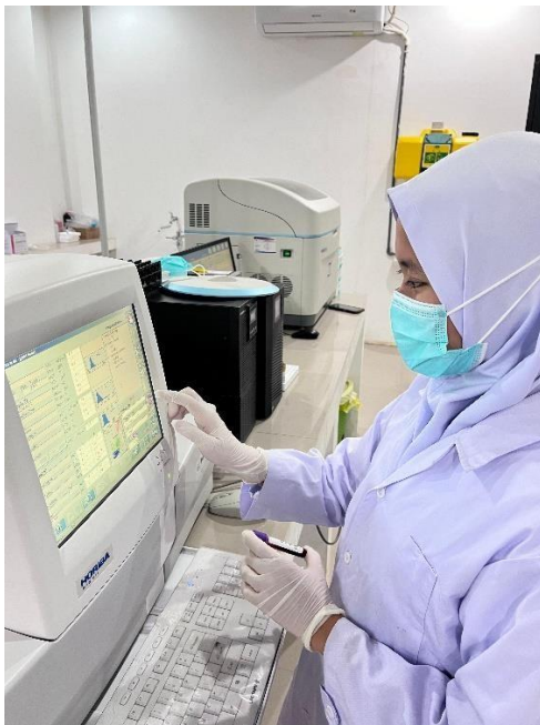
Proses Menjalankan Alat dan Pembacaan Hasil