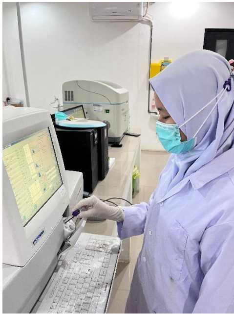
Proses Memasukkan Sampel Ke dalam Alat Hematology Analyzer