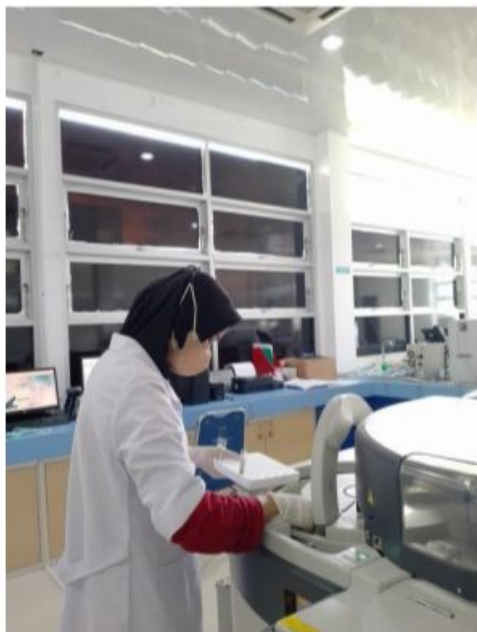
Proses memasukan sampel ke dalam alat otomatis Spektrofotometer Merk Symex BM-6010