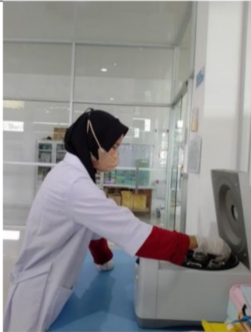
Proses sentrifus sampel