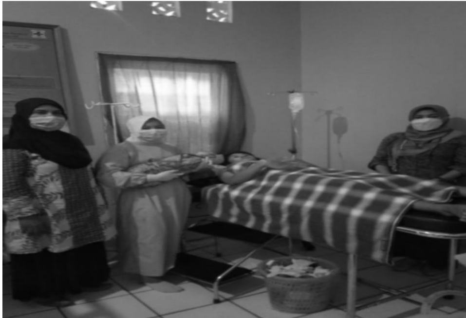
BBL (2 Juni 2022)