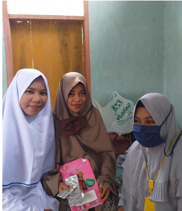
Foto Kunjungan kedua Di Posyandu